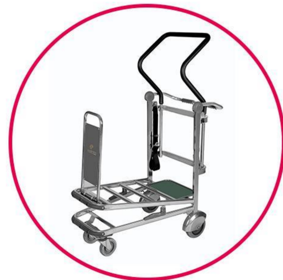
Golf club cart